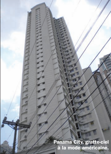
Panama City, gratte-ciel à la mode américaine.

de descendre un instant sur la plateforme ouverte pour profiter du spectacle cheveux au vent et photographier les navires au passage.