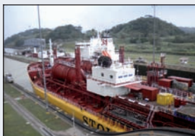
Le passage des écluses, un moment délicat et spectaculaire.

Après avoir mené à bien la construction pharaonique du canal de Suez, Ferdinand de Lesseps donne le premier coup de pioche du canal de Panama en 1880. Mais après neuf ans de travaux acharnés, perturbés par des conditions climatiques difficiles et des maladies tropicales qui déciment ses équipes, l'ingénieur français doit se résoudre à jeter l'éponge. Le projet est arrêté, la société ruinée. Mais Lesseps ne s'avoue pas vaincu. Il crée une nouvelle société en 1894. Les travaux redémarrent, mais se soldent rapidement par un nouvel échec. La concession est cédée dix ans plus tard aux Américains et il faudra encore dix années, 75 000 ouvriers et 400 millions de dollars pour terminer les travaux. Finalement, le canal est inauguré le 15 août 1914. Il comprend un très sophistiqué système d'écluses qui permet aux géants des mers de se hisser jusqu'au lac Gatun (26 m au-dessus du niveau de la mer) sur lequel ils voguent sur 80 kilomètres pour passer d'un océan à l'autre. Le canal restera sous tutelle américaine jusqu'en 1999, date à laquelle il est rétrocédé à la République de Panama. Les Américains quittent alors le pays, mais conservent un regard attentif sur cette infrastructure qui compte parmi les points les plus névralgiques de la planète.