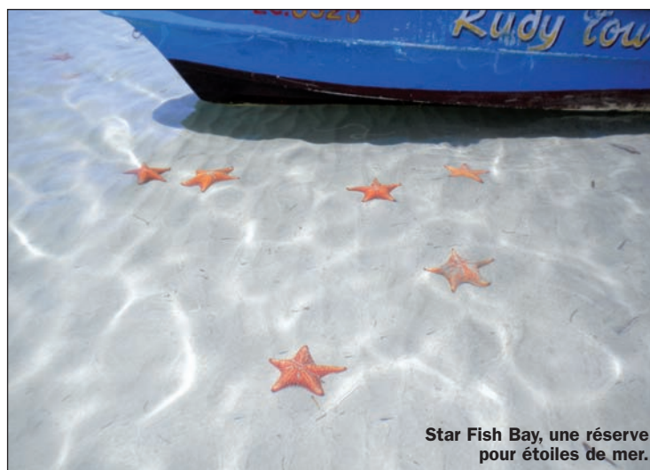
Star Fish Bay, une réserve pour étoiles de mer.

D éjeuner sur les rivages de l'Atlantique, dîner sur le Pacifique. Bienvenue, vous êtes à Panama, un petit pays d'Amérique centrale qui compte parmi les plus riches de la région grâce, notamment, à son canal qui traverse cet isthme d'une largeur de 80 km seulement. Point de passage obligé pour relier l'Atlantique au Pacifique, Panama concentre un trafic maritime qui donne la mesure du commerce maritime à l'échelle mondiale. Les énormes porte-conteneurs qui